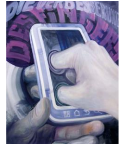
Die Verbesserung des Fingers, 2012, Öl auf Papier, 175 x 150 cm.

Zum Auftakt der neuen Kunstsession freut sich die Samuelis Baumgarte Galerie Ihnen die umfangreiche Einzelausstellung „Trennungen bei Wörtern & Menschen“ des einflussreichen Berliner Künstlers Gunter Reski (*1963 in Bochum) mit 55 Werken zu präsentieren. Nach langer Zeit können wir endlich wieder gemeinsam den Beginn einer Ausstellung mit einer großen Vernissage feiern - zu der wir Sie am 18. September um 19 Uhr ganz herzlich einladen! Zudem garantiert unser umfangreiches Hygienekonzept Ihnen einen sorgenfreien Besuch der Veranstaltung und Ausstellung.